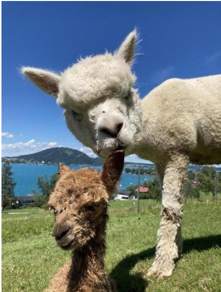
Alpaca Photo 3