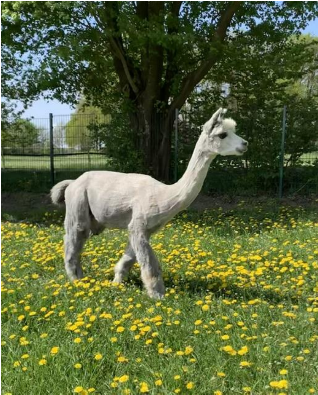
Alpaca Photo 1