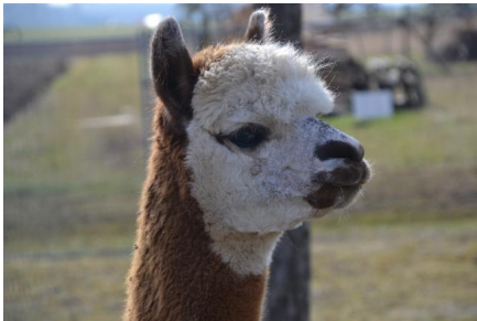
Alpaka Foto 2