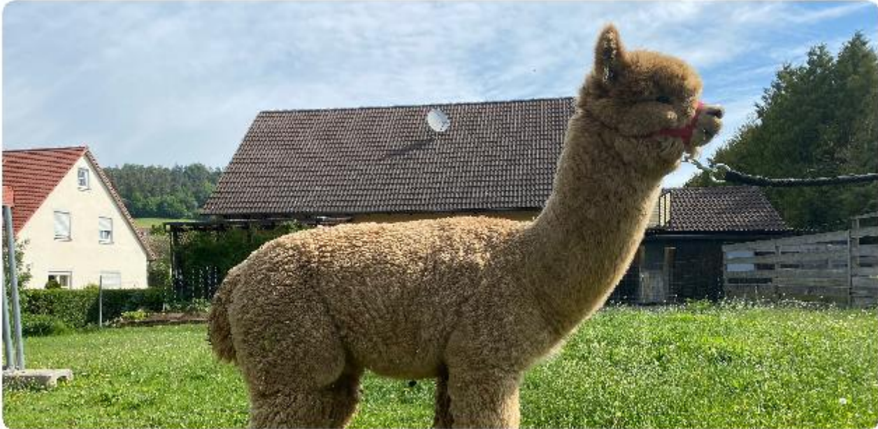
Alpaka Foto 1