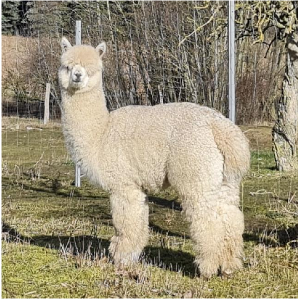
Alpaka Foto 2