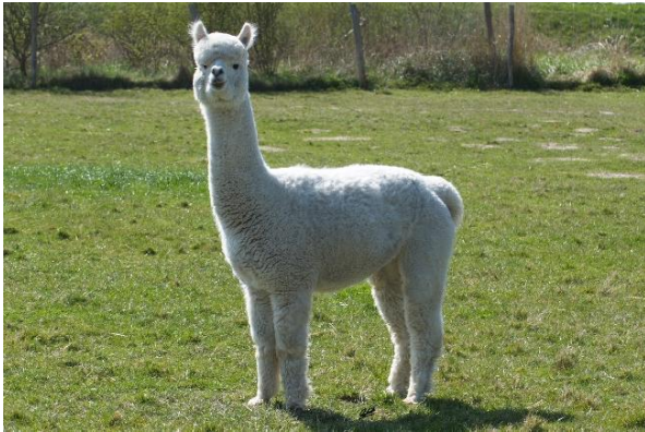
Catalina Exterieur 2