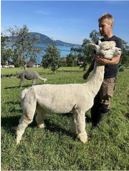
Alpaca Photo 2