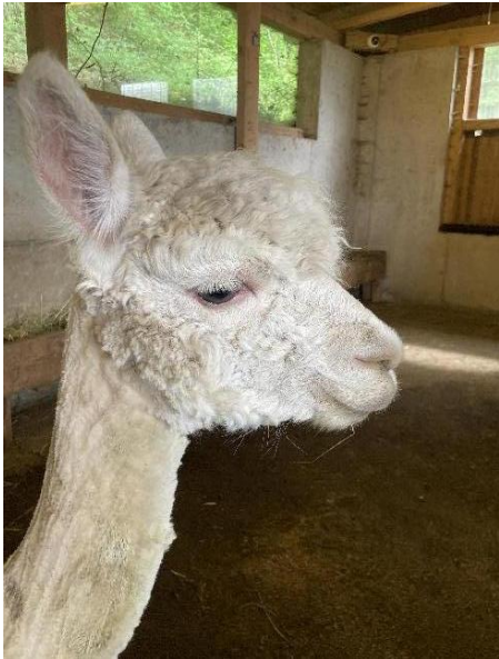
Alpaca Photo 3