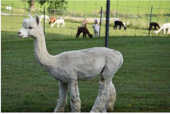
Alpaca Photo 2