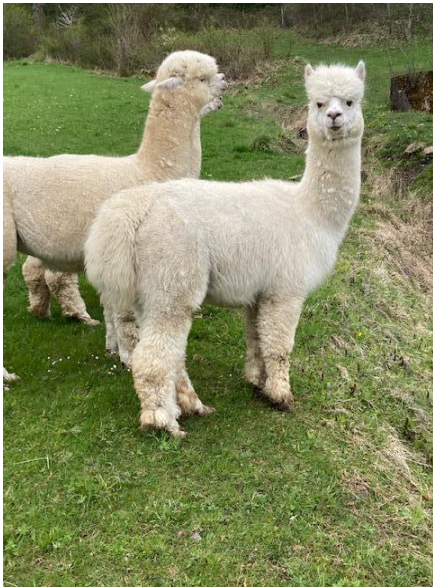
Alpaca Photo 3