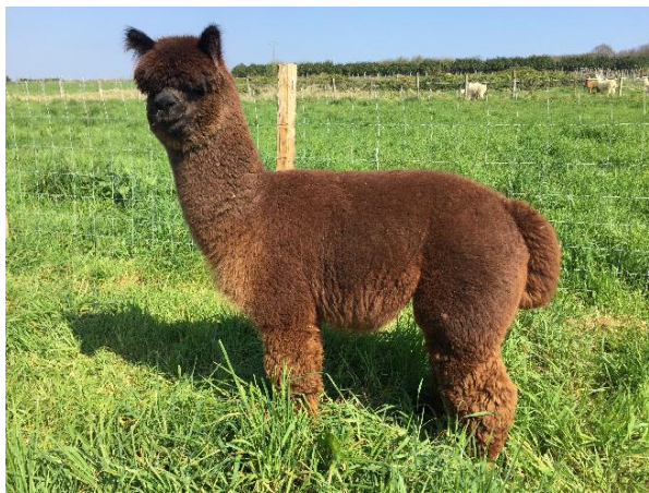
FLASH du ROMPAY