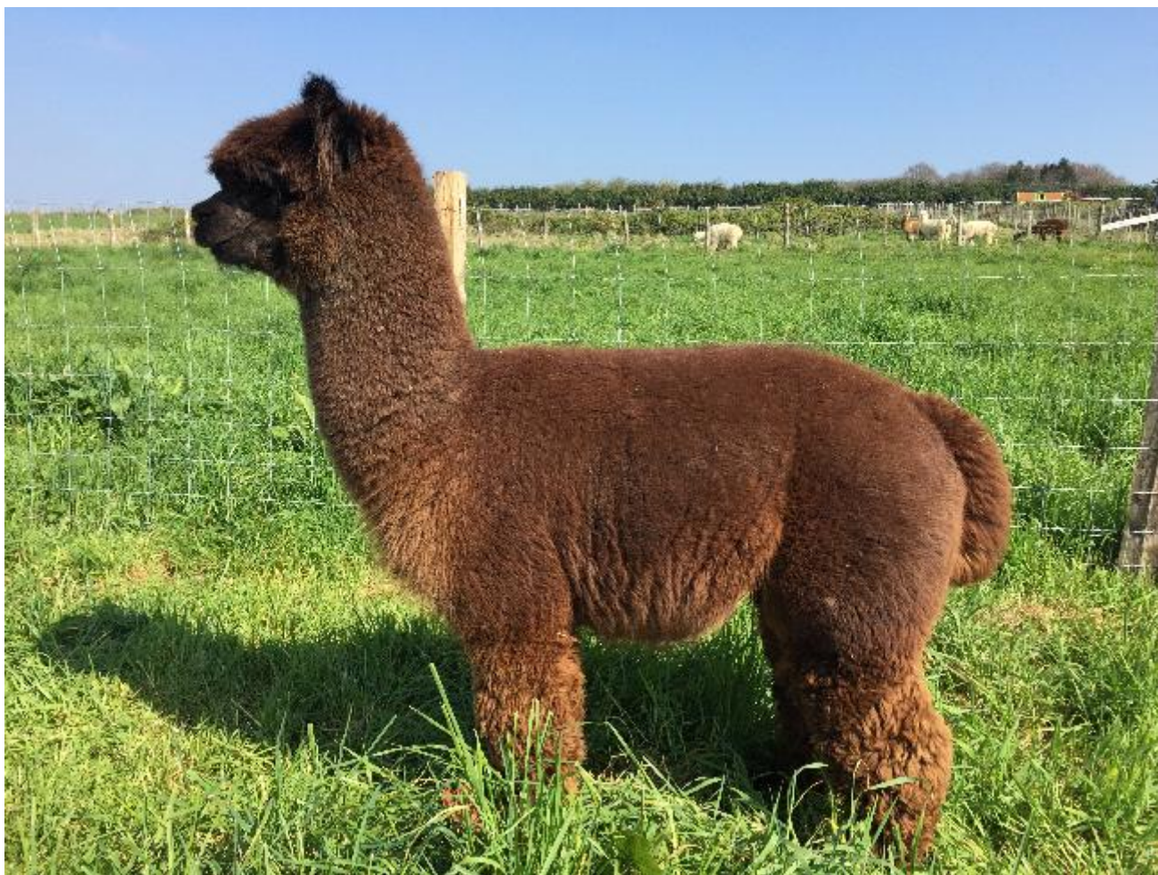
FLASH du ROMPAY