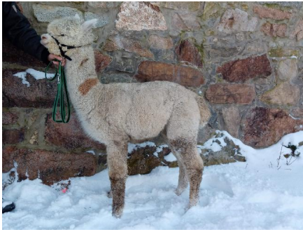
Alpaca Photo 2