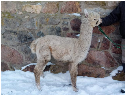
Alpaca Photo 3