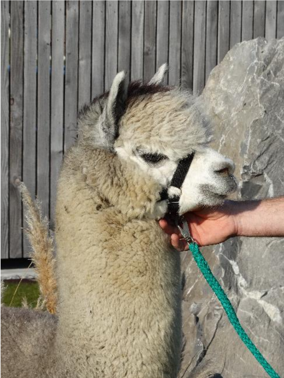
Alpaca Photo 1