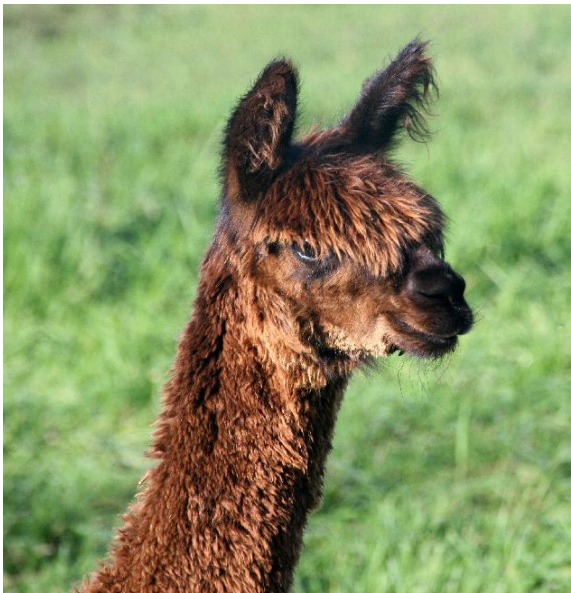
Alpaca Photo 3