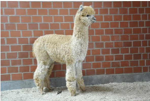
Alpaca Photo 1