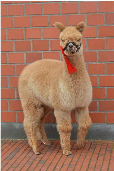
Alpaca Photo 2