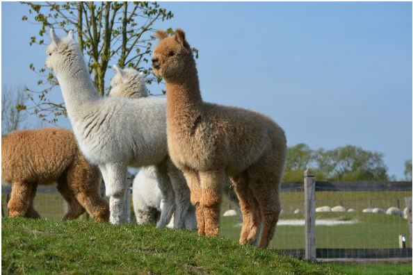
Alpaca Photo 3