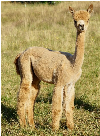
1. Vlies Chestnut