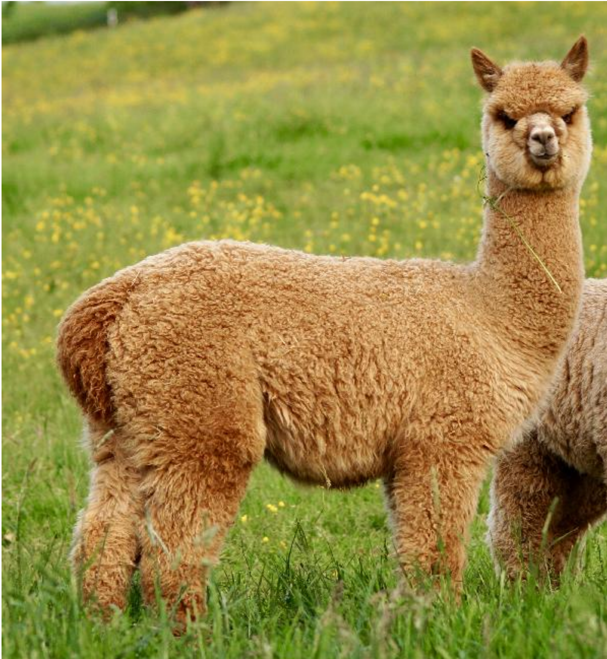
Chestnut vor der Schur 2018

Anlässlich unseres 15-jährigem Jubiläum ist der Preis von Chestnut von 4.800 Euro auf 4.000 Euro reduziert. Eine einmalige Gelegenheit.