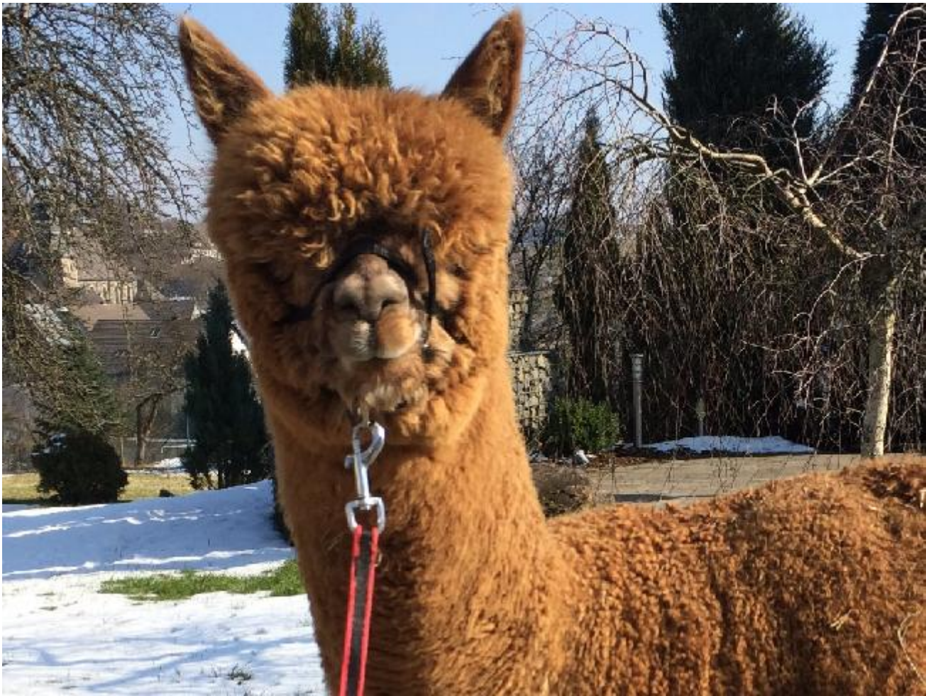
Alpaca Photo 1